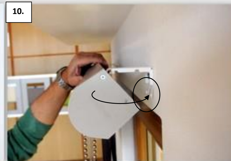
10. Zeď - docvakněte spodní hranu boxu na držáky.