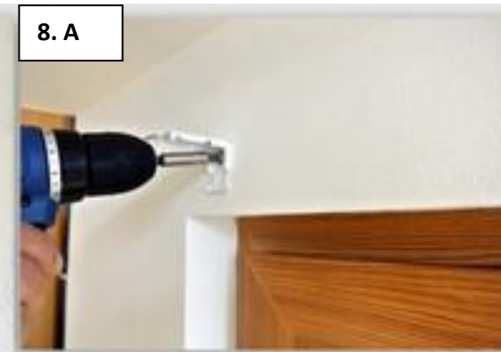
8. A Další typ uchycení je uchycení konzoly na zeď.