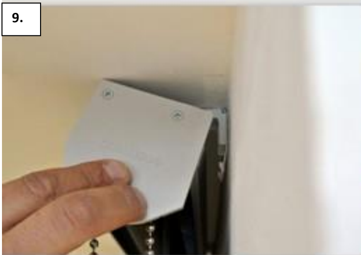
9. Strop - box nasadíte horní hranou na konzoly. Poznámka: box nejde nasadit – držáky nejsou v rovině