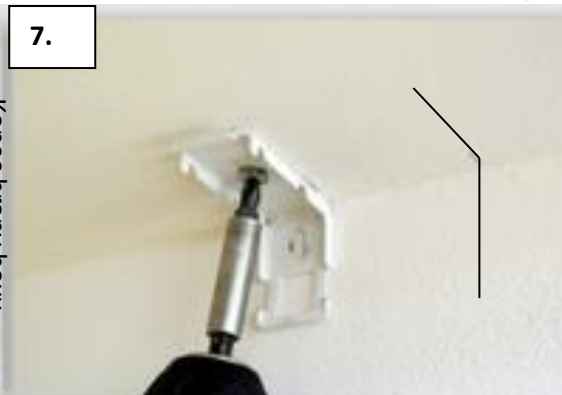
7. Uchycení konzoly na strop.